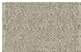
08 ZEALAND TAPPETO CM 550X550 - SPECIAL SIZE