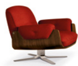
04 LAUREL POLTRONE CM 96X97 H76