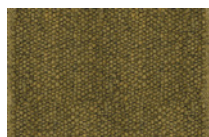
08 ZEALAND TAPPETO CM 550X450 - SPECIAL SIZE