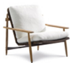
03 TRIO POLTRONE CM 80X90 H75 - MIX "B"