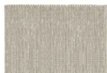
07 OSAKA TAPPETO CM 400X300