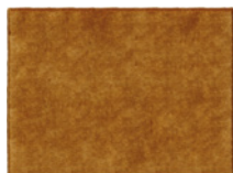
07 FAIRWAY TAPPETO CM 700X400 - SPECIAL SIZE