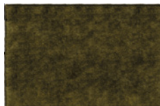
10 FAIRWAY TAPPETI CM 450X325 - SPECIAL SIZE