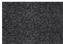
08 WISP TAPPETO CM 500X400