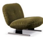
06 LIBRA POLTRONE CM 76X86 H73