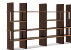
12 ZOE LIBRERIA CM 60X46 H103