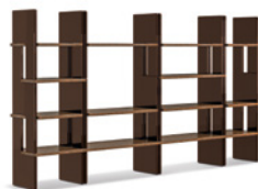
11 ZOE LIBRERIE CM 100X46 H103