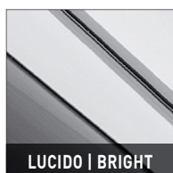
LUCIDO | BRIGHT