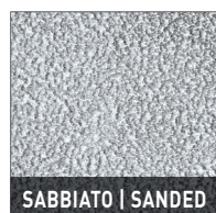
SABBIATO | SANDED